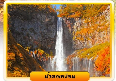
น้ำตกเคงอน