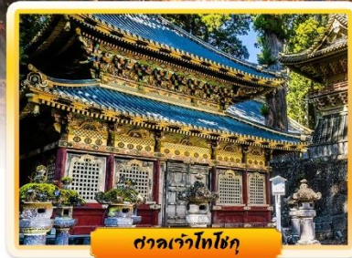
ศาลเจ้าโทโชกุ