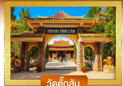
วัดตึกลิ้ม