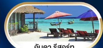
อังคา รีสอร์ท