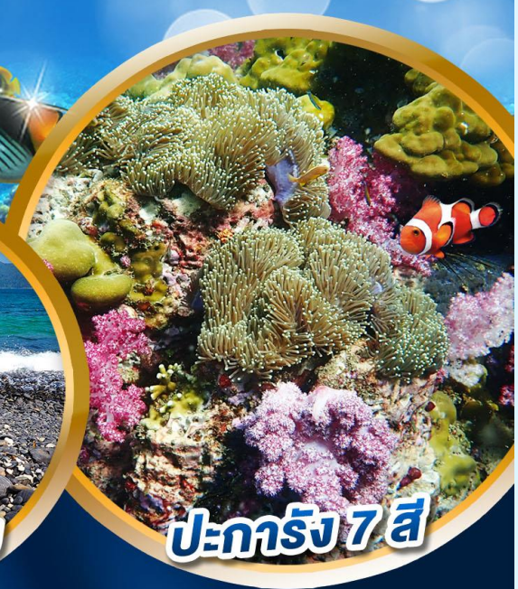
ปะการัง 7 สี