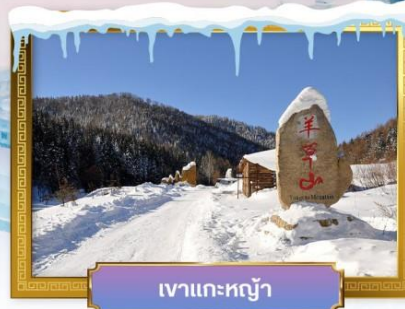
เขาแกะหยู๋